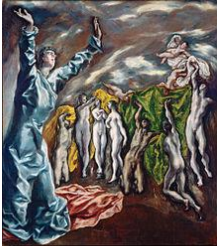
Ελ Γκρέκο, Η Πέμπτη Σφραγίδα της Αποκαλύψεως

Έκθεση εικαστικών έργων των μαθητών του σχολείου μας, εμπνευσμένων από τη ζωγραφική του Γκρέκο.