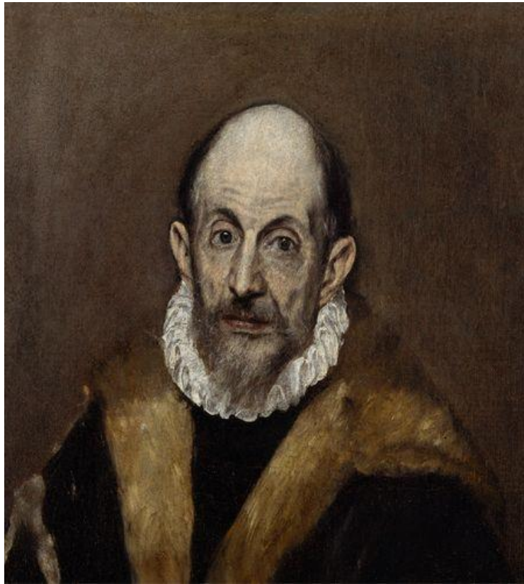
Ελ Γκρέκο, Αυτοπροσωπογραφία (υποτιθέμενη)